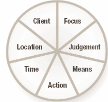
ICNP® 7 Axis Model