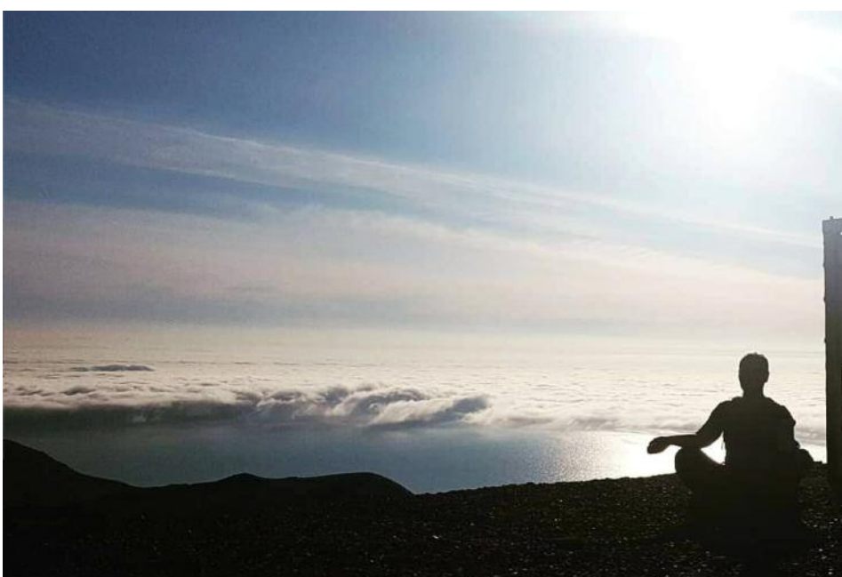
Sólsetur, jóga og trjálundur.