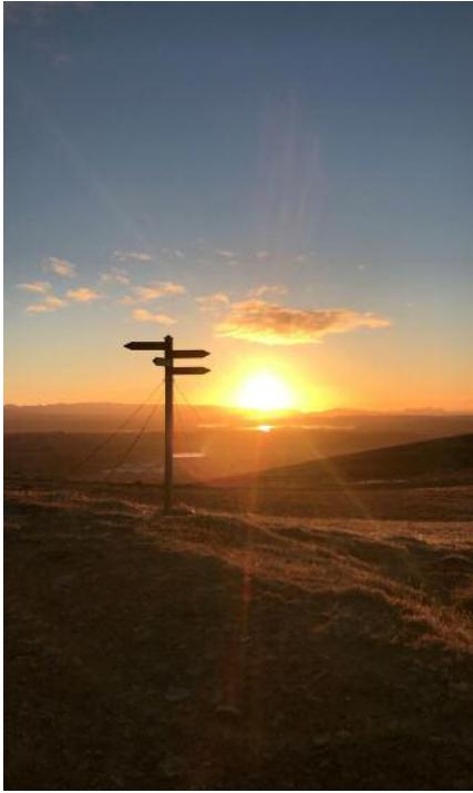
Sólsetur við Úlfarsfell 2018.