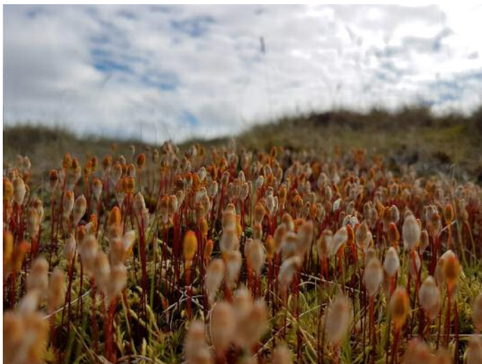
Lífriki jarðar.