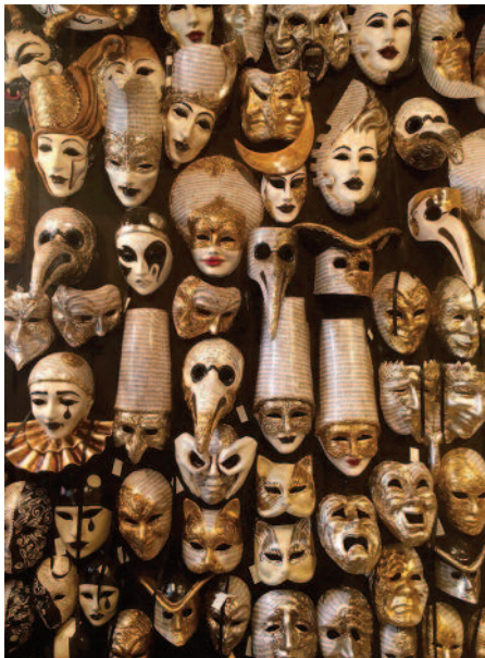
Feneyjagrímur eftir Björk Bragadóttur.

Fjöldi fallegra mynda barst í ljósmyndasamkeppni Tímarits hjúkrunarfræðinga fyrir þetta tölublað. Íslensk náttúra var í aðahlutverki og augljóst að hjúkrunarfræðingar sækja í náttúruna til að endurheimta orkuna. Forsíðumyndin, sem varð fyrir valinu, er tekin í fjörunni á Ingjaldssandi af Rudolf Adolfssyni.