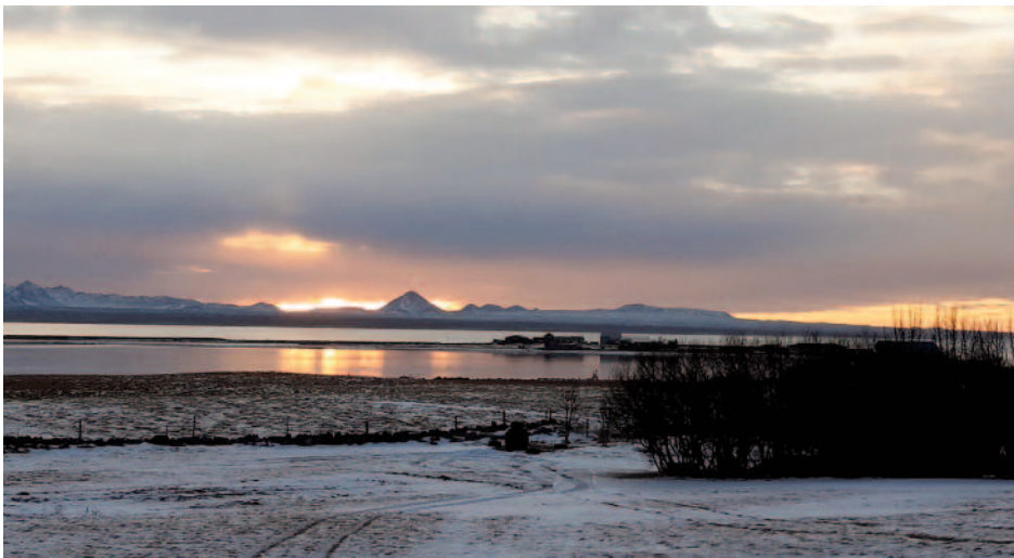
Lína Gunnarsdóttir tók þessa mynd af Keili frá Álftanesi á vetrarsólhvörfum 2019.