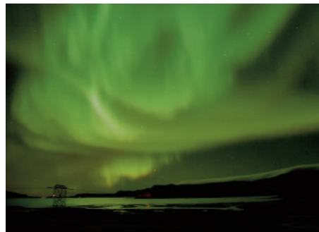
Norðurljós frá botni Hvalfjarðar.