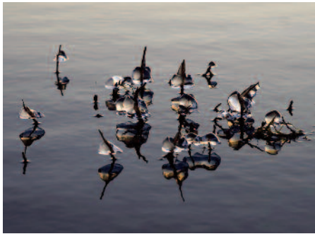
Klakkamynd frá Kleifarvatni.