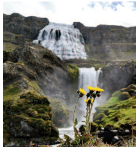
Dynjandi í Arnarfirði.