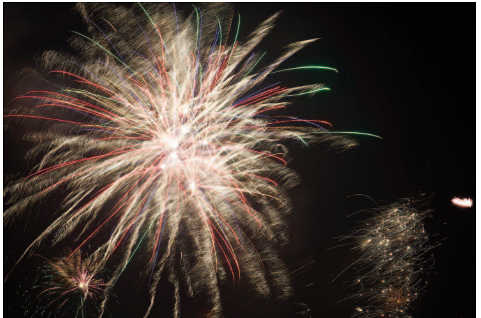
Merku ári fagnað í sögu hjúkrunar.

Tímarit hjúkrunarfræðinga þakkar þátttökuna og birtir nokkrar innsendar myndir.