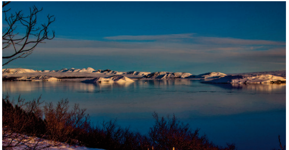
Þingvallavatn í vetrarham.