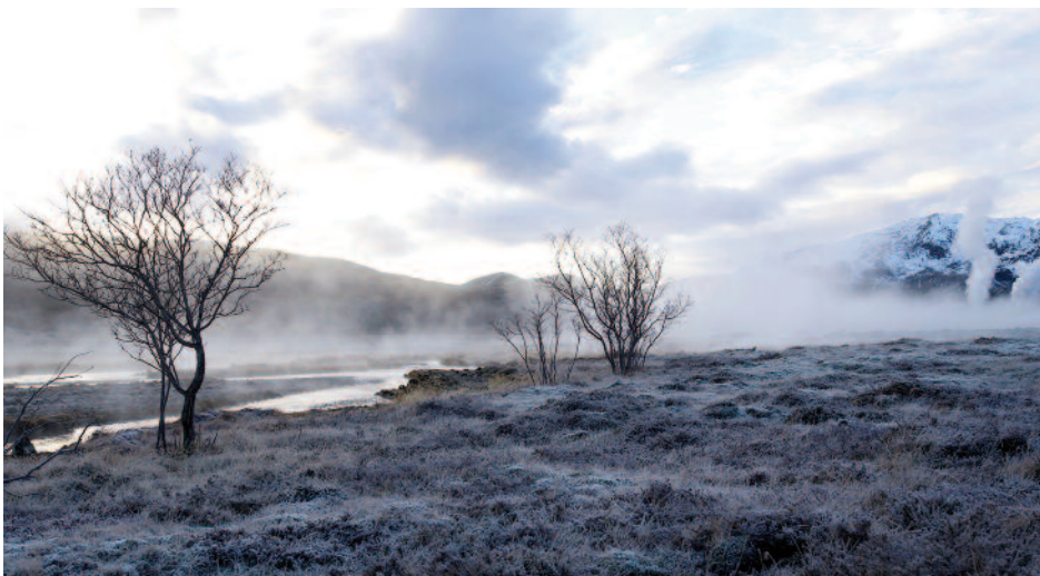
Frostrímuð jörð í Grafningnum.